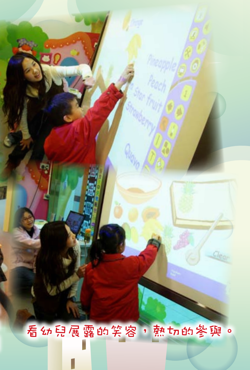
看幼兒展露的笑容，熱切的參與。

保良局金卿幼稚園教師運用電子白板，設計互動遊戲，提升幼兒學習效能。教師將有關的學習重點，設計成為遊戲軟件，把相關的資料以特別的顏色、動畫、圖形即時具體地在電子白板上呈現出來。幼兒透過白板上的圖像化訊息進行學習，較容易掌握抽象概念。