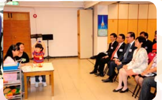
各位嘉賓欣賞中心的教學示範，並對弱聽兒童清晰的說話能力感到十分驚訝。

宣美中心於1981年開始專為弱聽幼兒而設的，為弱聽幼兒提供聽覺測驗及配戴合適的助聽器，使他們能盡早開始語言訓練，並透過使用弱聽兒童的剩餘聽覺，發展他們的語言能力及發音技巧，使他們能用口語說話（而無須使用手語）。中心更著重輔導家長在家協助孩子的語言發展，並協助受訓後語言良好的弱聽兒童入讀普通學校。不少學生已讀至大學，甚至就業。