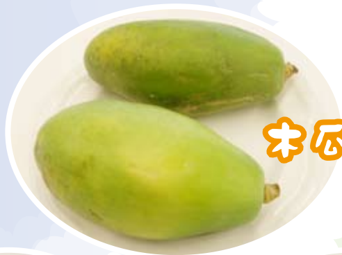
木瓜 功效：健脾益胃