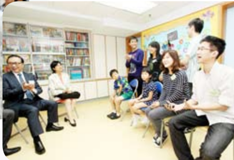
曾鮑笑薇夫人與中心的弱聽學生暢談。