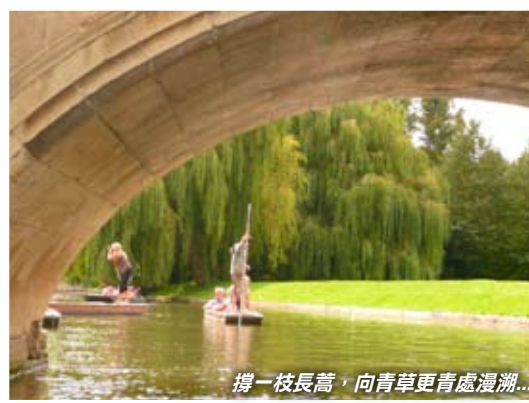
撐一枝長篙，向青草更青處漫溯...