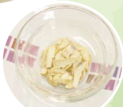
花旗蔘 功效：清虛火、滋陰養氣