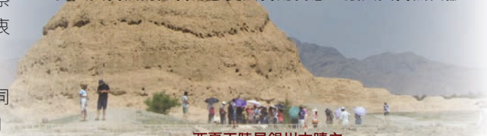
西夏王陵是銀川古蹟之一

在浩瀚的沙漠中，人顯得渺小。昔日盛世輝煌的西夏王朝已消失，金碧輝煌的建築已化為塵土，只剩下一座座矗立在廣漠大地上的黃土陵墓。 走進銀川幾處的旅遊點，體會到 人與自然的融合，寧夏人善用智慧，讓人與自然共融。