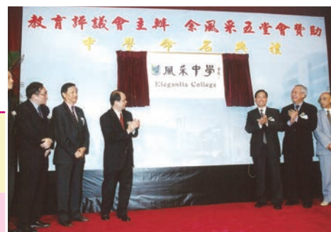
2002 年本校命名禮由教育署署長張建宗主禮