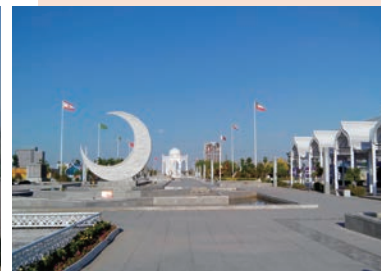
中阿經貿論壇永久會址

寧夏是全國五個自治區之一，香港則是享有高度自治的特別行政區之一；兩者同是「省」部級。這次教評會的教育考察算得上是平級交流呢。