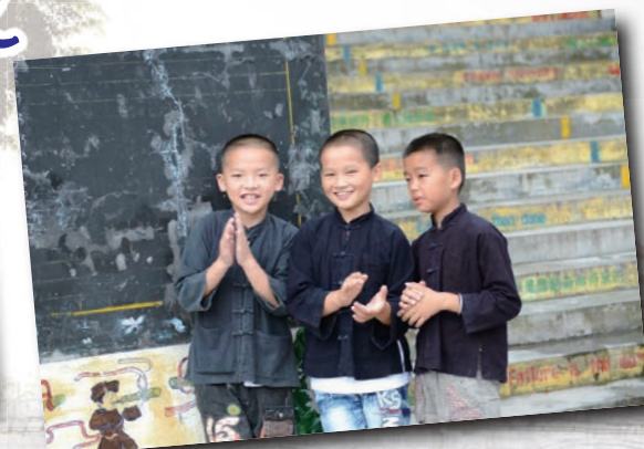
上衣民族裝，下裝牛仔褲的小男生