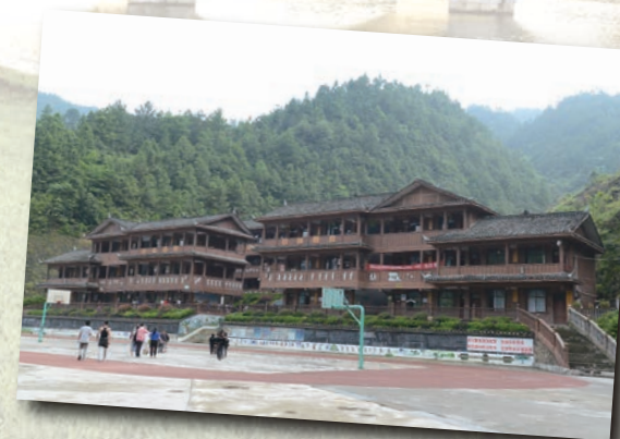
具民族特色的校舍