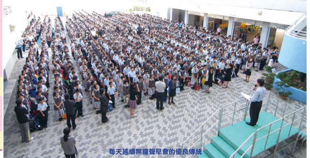
每天延續無鐘聲早會的優良傳統