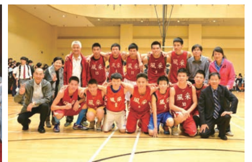
獎項—學界男籃甲組冠軍