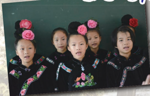
貴州小學生歌唱迎香港師生