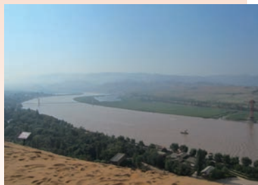
黃河與騰格里沙漠相遇，黃河在這裡形成一個巨大的彎曲

銀川是寧夏回族自治州首府，西倚賀蘭山，東臨黃河，素有「塞上江南」和「塞上明珠」的美譽。銀川的自然環境和人文風俗獨特，走進銀川會有更深的體會。