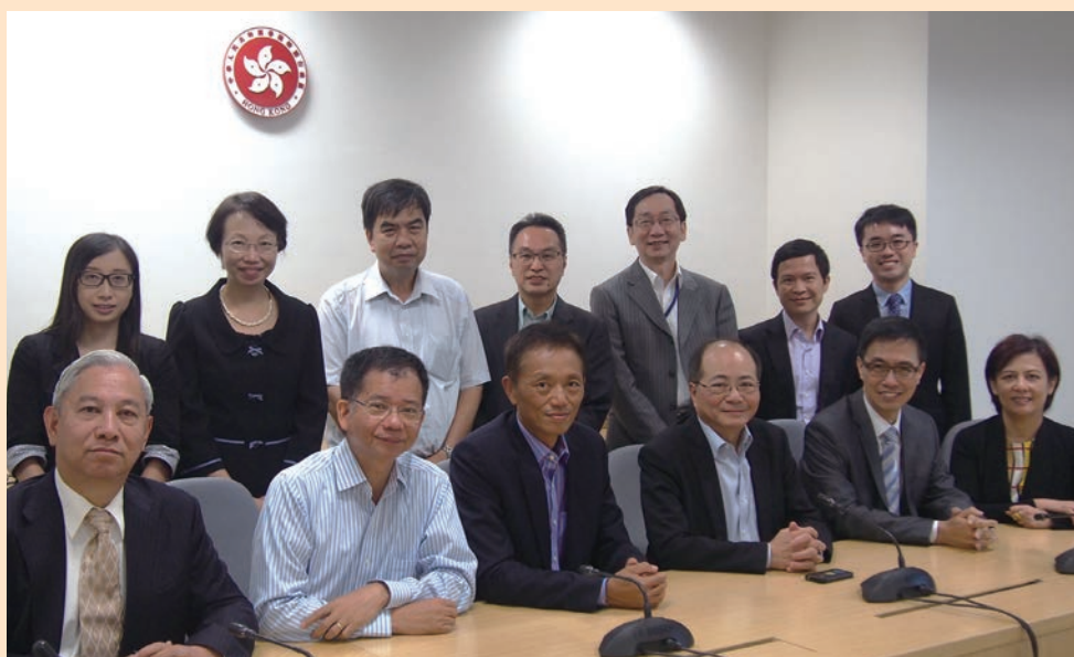
教評會執委會全人與教育局吳克儉局長及眾官員對話後合照