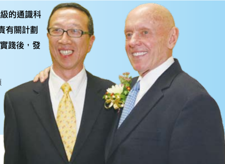
吳仰明校長與史提芬·柯維合照。

註一：史提芬·柯維是暢銷名著《與成功有約》作者，全球銷量1800萬冊，其中提及可達致高效能的7個習慣(7 habits)並在港設立培訓中心。