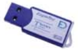
EagleTec 1GB 手指